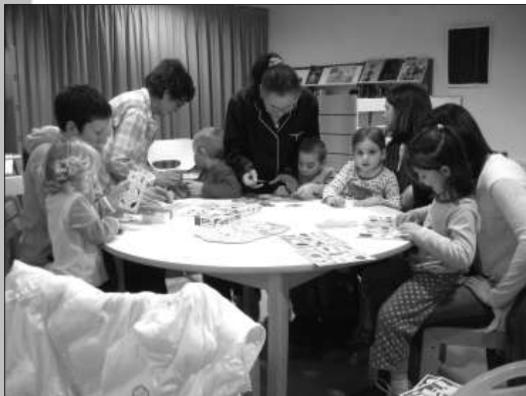
La soirée pyjama, une rencontre à renouveler

Le 31 janvier dernier, une sympathique soirée pyjama rassemblait petits et grands autour d'une collation. Jeux de société et lectures étaient au programme.