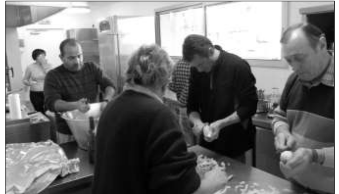
Les cuistots au travail

Pour plus de renseignements, vous pouvez contacter :