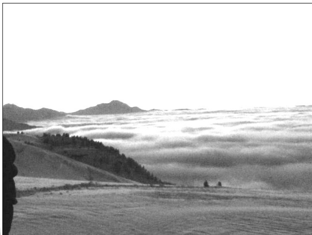
Superbe coucher de soleil à 1600 m