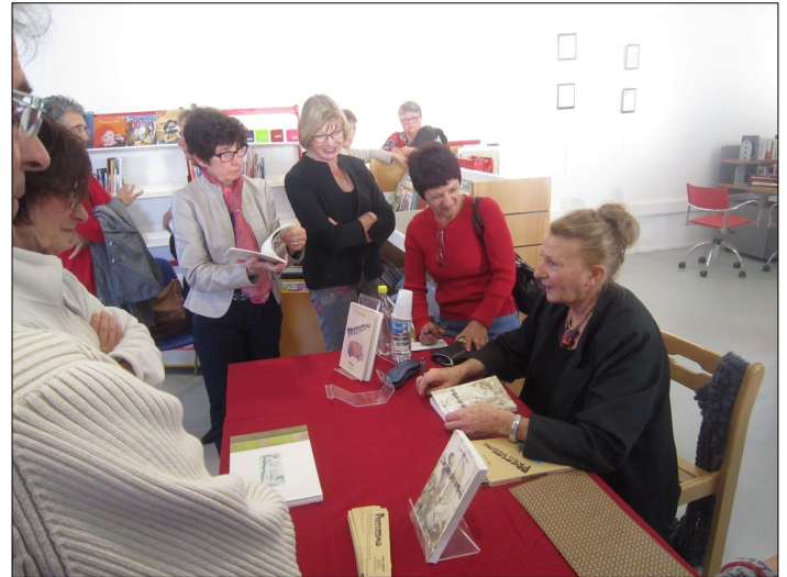
On se presse autour de la romancière.

pier fabriqué à Tartas et relié). « L'archer des ombres ». « Le fils de la montagne rouge ». « Prestissimo » le dernier tiré à 1000 exemplaires. Ses nouvelles : Les cahiers d'Annie entièrement confectionnés par l'auteur (impression et couverture) : « Le repas grec », « Le carnaval de Bilbao », « Les regrets de M Gabelle ».