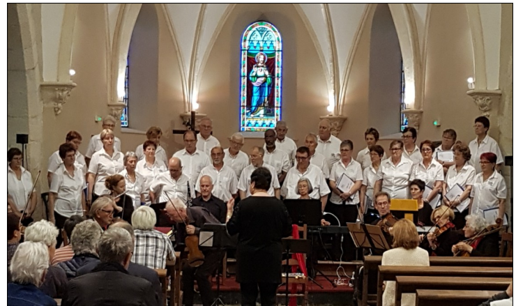
Les archets de l'Adour et Cante Louts réunis