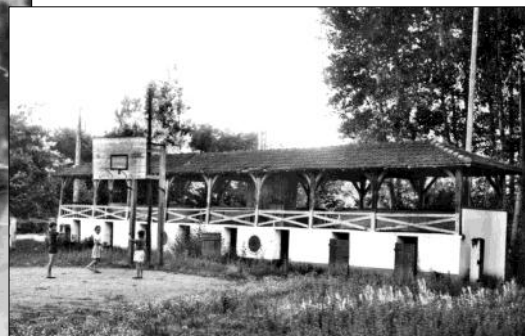
Les anciennes arènes de Sort