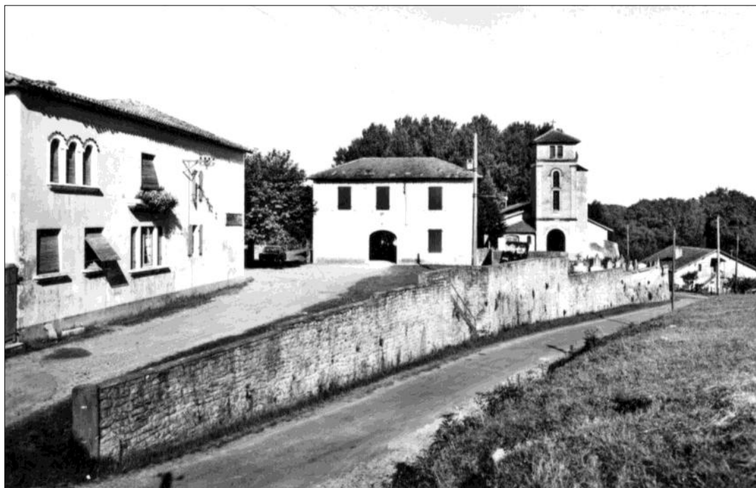
Le bourg de Sort dans les années 50