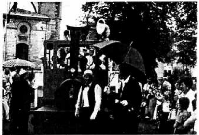
JAZZ'PARD MOBILE AUX FÊTES DE DAX