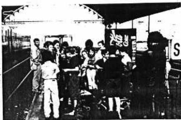
Départ en gare de Dax...