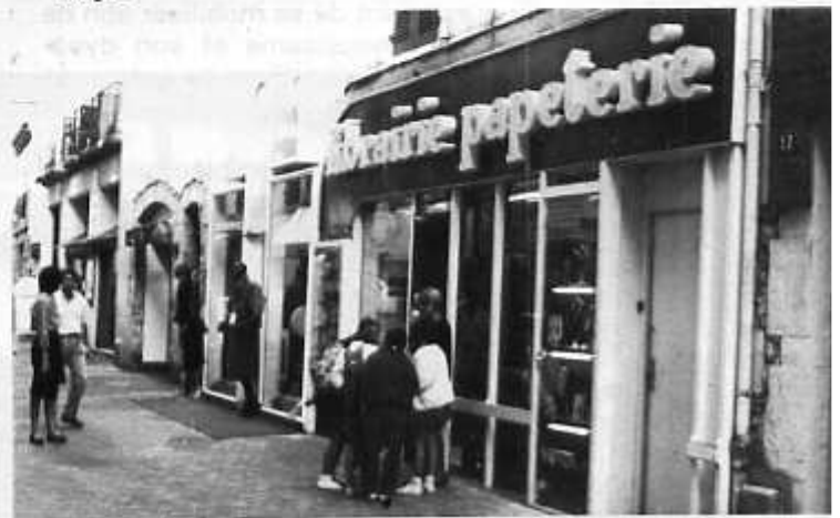
Les enfants de Hinx à Dax, lors de leur enquête sur les commerçants, rue Neuve

Leur riche travail a été récompensé par une dotation de 7 500 F pour aider à l'organisation à une classe de neige.