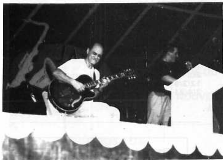
PASS la guitare...

Depuis longtemps, on n'en parlait plus et comme le Beaujolais Nouveau, le voilà de retour.