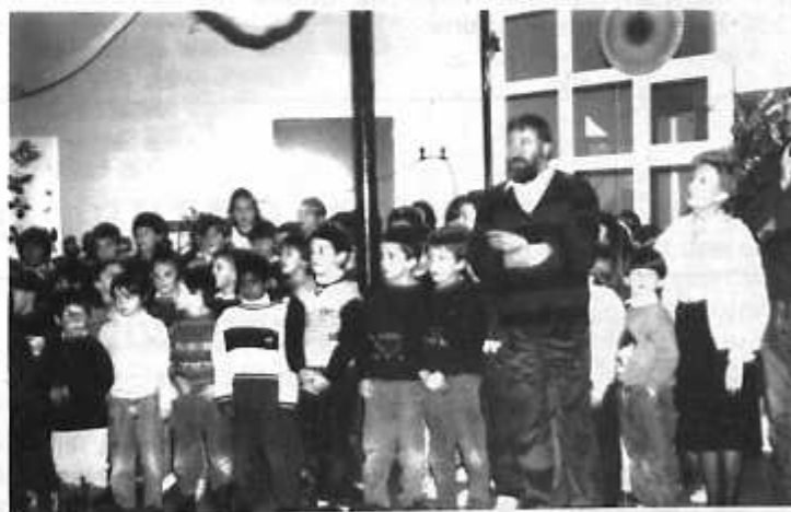
Très sages pendant les discours...

Cette somme permettra de minorer de 40% la participation des parents des CM1/CM2 au financement de