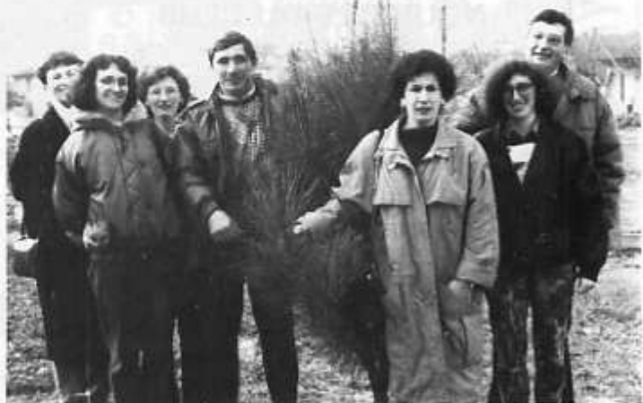
Histoire de PINS

Une date à retenir: 7 avril 1991 : bal à Papa, Salle de Sports. L'Association des Parents d'Elèves souhaite à tous une très bonne année 91. Le Bureau.