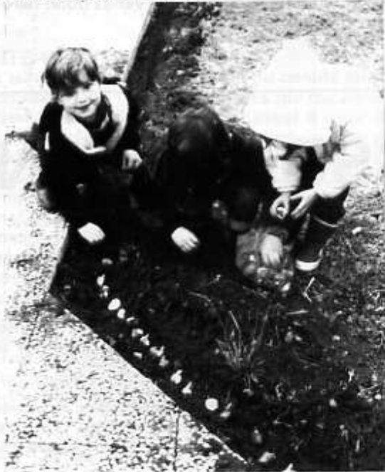
Les jeunes pousses plantent...

Les petits jardiniers aux mains vertes vont poursuivre leurs efforts d'embellissement de leur environnement et par là de découverte des merveilles de la nature.