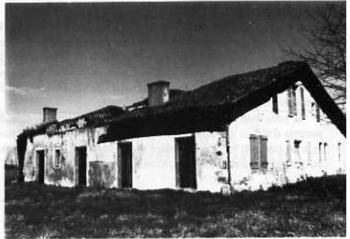
La maison "Mariette"