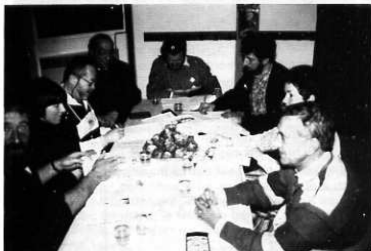
Préparation du journal