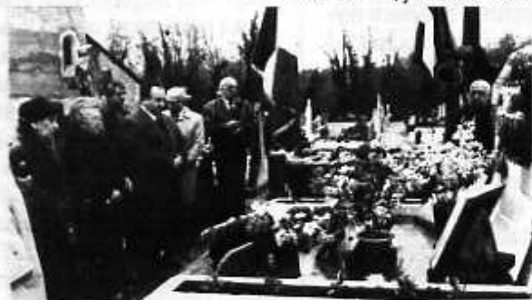
Ceux qui l'ont connu ne manquent pas chaque année, de se recueillir sur sa tombe.