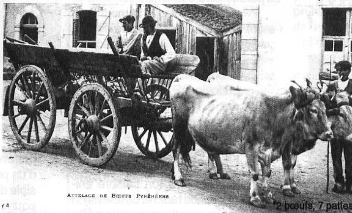
ATTelage de boeufs pyrénéens