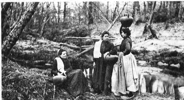
"La semaine prochaine, j'enlève le haut"

Laissons les hinxois et hinxoises de cette fin du XIX e siècle à la vie de la campagne chalossaise où ils goûtaient le calme, même si on entendait bien parler de voyages, d'installation du chemin de fer, du télégraphe et du téléphone. Ils restaient loin des embarras de Paris où la Tour Eiffel venait d'être inaugurée par le Président Sadi Carnot. Leur vie de durs labeurs sans machinisme suscite toutefois notre admiration car ils savaient vivre en harmonie avec la nature, entourés de leurs voisins et de leurs familles élargies à plusieurs générations. Il est temps de refermer la page du livre d'histoires.