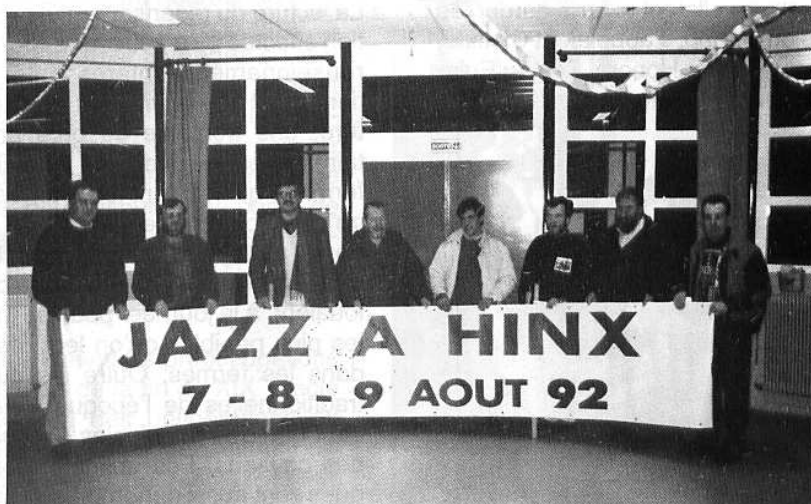
La nouvelle affiche