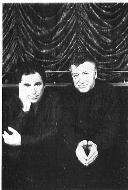
"Vague à l'âme des Poètes"

Cette année encore, les organisateurs ne se refusent rien et ne sont pas peu fiers d'annoncer leurs "super vedettes" ! Claude NOUGARO à Hinx, c'est déjà un évènement dont on parle fort autour des berges de l'Adour mais également à plusieurs lieues à la ronde ! Il conviendra de se manifester suffisamment tôt pour pouvoir constater sous le chapiteau hinxois s'il y a