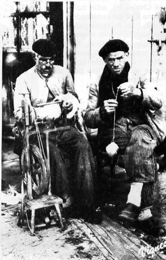
"Si je t'assure, c'est un pendule"

grand bac: ils ont la possibilité de tenir chacun un batelet à la condition d'en faire la déclaration et d'en acquitter un droit à la Commune.