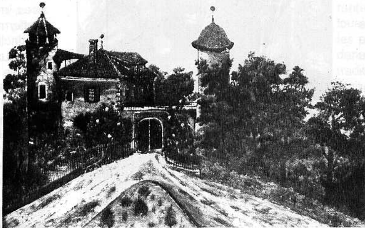
Castéra des champs (18 e me s.)

nie par lettres patentes de mai 1462 par le roi Charles VII, enfin maître de la Gascogne. Ces lettres concèdent au baron de HINX, droit de haute justice et fourches patibulaires, lots et ventes, amendes des meurtres et blessures, facultés d'établir des juges, baillis, consuls et autres officiers, à charge seulement de foi et hommage au roi et d'une paire de gants à nuance de seigneur.