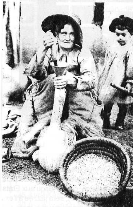
Et l'oie ne parla pas..

Les enfants jouaient aux billes, au cerceau, ou allaient aider à garder les bêtes au champ, s'appelaient Clotilde, Paulin, Noëline, Honoré, Zoé ou Eulalie. Les écoliers garçons Martial, Jean-