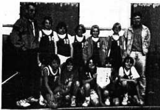
Photo - Les finalistes autour de leurs entraîneurs

Nos poussines ont, elles aussi, réalisé une belle saison. Evoluant en série A tout