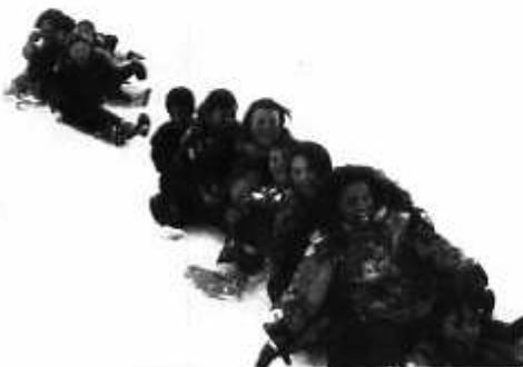
Classe de neige

Nombreuses ont été les visites et promenades qui nous ont permis de mieux connaître la vallée et la vie en montagne.