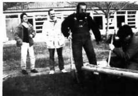
PARENTS AU TRAVAIL

Les élèves des G.S - C.P et CE1 ont eu le plaisir de voir jouer, à l'école, la légende du roi Meidas par la troupe Mariska.