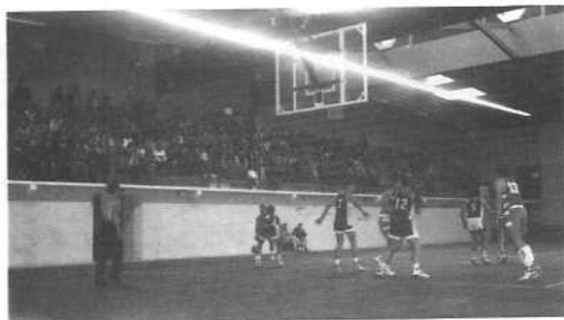
Les gradins copieusement garnis pour le derby HINX-SORT