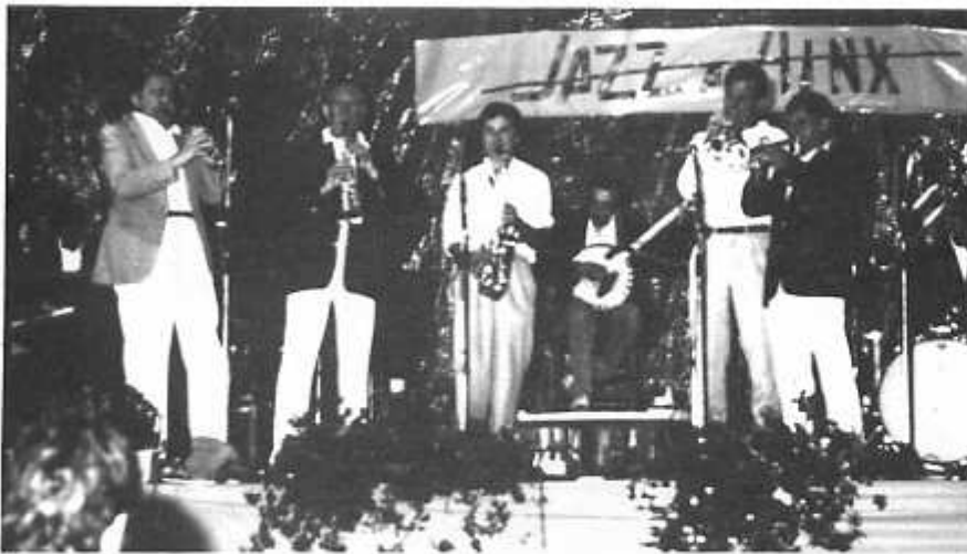
La jam session de clôture de la soirée New Orléans du Festival 1987 Pierre ATLAN, Claude LUTER, Cyril GUYOT et Eric LUTER

Le résultat ne se fit point attendre, et, au fil des ans, JAZZ A HINX est ainsi devenu l'un des rendez-vous importants de l'été.