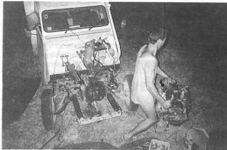
Le "mécano du désert"

lendemain vers 10 heures. Encore une petite attente pour l'embarquement, la traversée, et c'est Tanger qui nous voit débarquer. La circulation, les odeurs, le mode vestimentaire, etc... nous étonnent. Une nuit sur la plage nous remet en forme avant de nous diriger sur