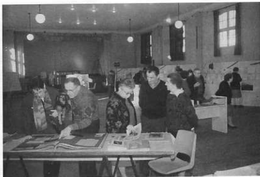
Des Hinxois intéressés, penchés sur le livre d'histoire du village