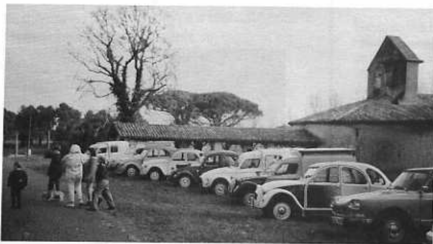
Une halte à OUSSE-SUZAN