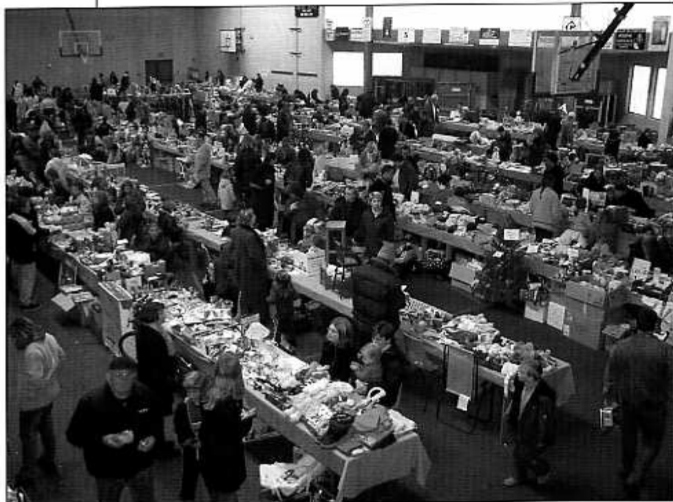
Remarquable succès de la Foire aux jouets de décembre. Un monde fou !

G âce aux deux manifestations du mois de décembre, Foire aux jouets et Vente des sapins, l'APE de Hinx a pu encaisser plus de 2000 Euros de bénéfices. Merci aux parents bénévoles qui sont venus aider et participer.