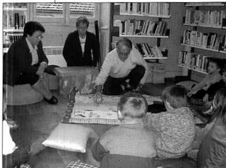
L'itinéraire des Mots : Raconte-Tapis pour les petits de maternelle.