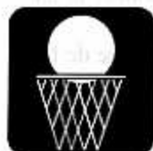
L'équipe Minines Filles en demi-finale régionale ?