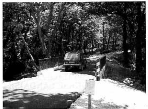
Le nouveau pont sur la V.C. 5 de Hinx à Goos est ouvert à la circulation depuis le vendredi 23 juin dernier.