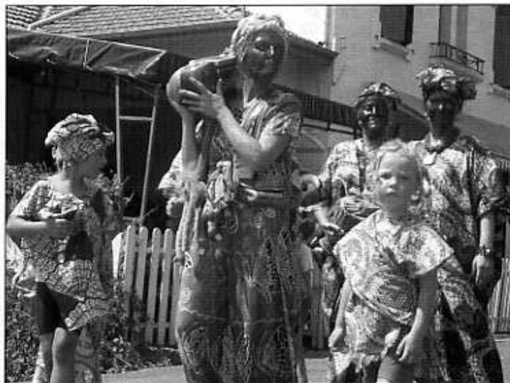
Quelques membres de l'APE lors de fêtes de Hinx