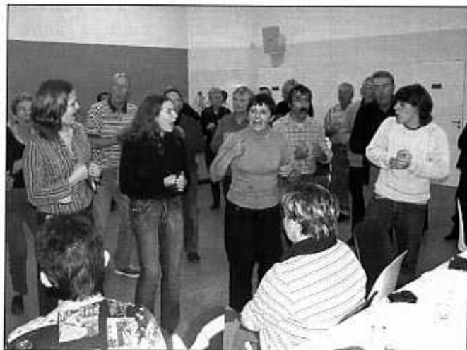
Rencontre conviviale entre les deux chœurs de l'Odyssee et Cora de la Vita