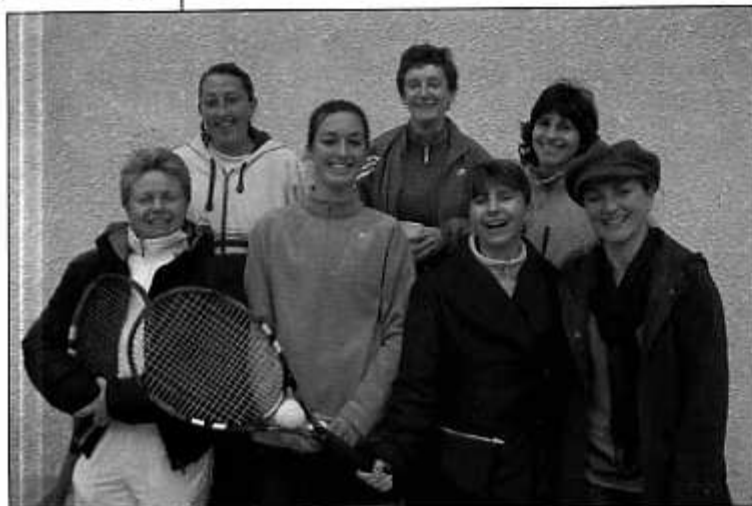
La redoutable équipe des filles