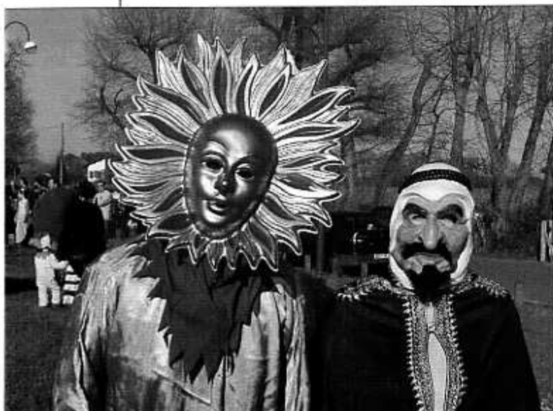
Carnaval de Venise ? Non, carnaval de Hinx !

Après quelques détours, le défilé a pris le chemin des arènes, accompagné cette année,