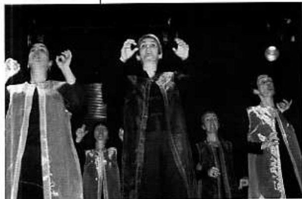
Féminin Pluriel sur la scène hinxoise