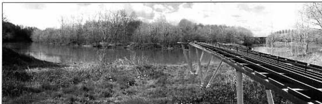
Le futur visage du port de Hinx

S uite aux propositions de la Commission « Tourisme » du Conseil Municipal, il sera bientôt possible de traverser aisément l'Adour au niveau du port et de fréquenter les forêts communales de Hinx situées sur la rive droite de la rivière. L'antique bac ne reprendra pas du service. Mais une solution originale vient d'être trouvée.