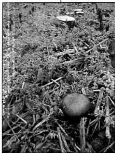
Des champignons à gogo, dans les champs, au printemps.

Un tel phénomène de "pousse" extraordinaire avait déjà été observé dans notre région il y a six ans.