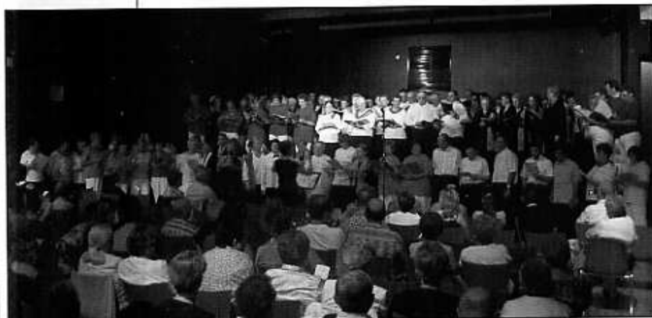
Superbe fête de la musique organisée par l'Odysée le 16 juin dernier.